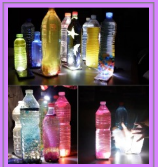
Fotografía del último laboratorio del RETO: Descubre el poder de la luz. En él se debía fabricar una lámpara de Moser.