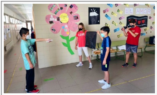
LOSCIENTILOCOS, CEIP LA OLIVARERA - HELLÍN (CASTILLA-LA-MACHA)

Durante la edición, nos consta que ¡¡ha pasado de todo!! Habéis experimentado, aprendido, descubierto, divertido y hasta... ¡¡invadido vuestras escuelas!: