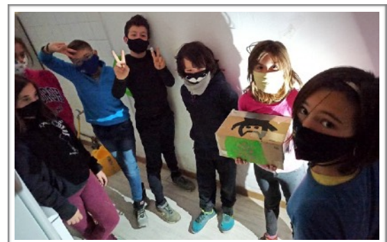
CIT (CALDEARENAS INSTITUTO TECNOLÓGICO), CEIP VIRGEN DE LOS RÍOS - CALDEARENAS (ARAGÓN)