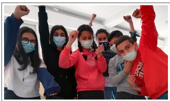
NOPALITOS, CRA DE SANGARCÍA - SANGARCÍA (SEGOVIA)

TODO ESFUERZO TIENE SU RECOMPENSA... ¡LA META!