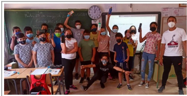
CIENTÍFIC@S CURIOSOS, CEIP SAN ANTÓN - FORTUNA (MURCIA)

¡ALGUNAS PULSERAS ESTÁN EN CAMINO Y OTRAS HAN LLEGADO YA! ESPERAMOS QUE OS GUSTEN Y LAS LUZCÁIS ESTE VERANO :)