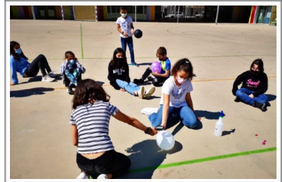
PANA-FRESCOS 5B, CEIP CERVANTES - EJEJA DE LOS CABALLEROS (ZARAGOZA)

Los que en cambio os atrevisteis con Descubre el poder de la luz os habéis enfrentado a retos como: