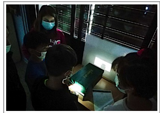
5ºB GÓMEZ MORENO, CEIP GÓMEZ MORENO - GRANADA