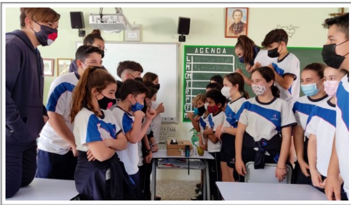
NUCLEÓNICOS, COLEGIO MARISTAS CÓRDOBA - CÓRDOBA

A través de los informes hemos podido ver cómo aprendíais y os superabais laboratorio tras laboratorio: