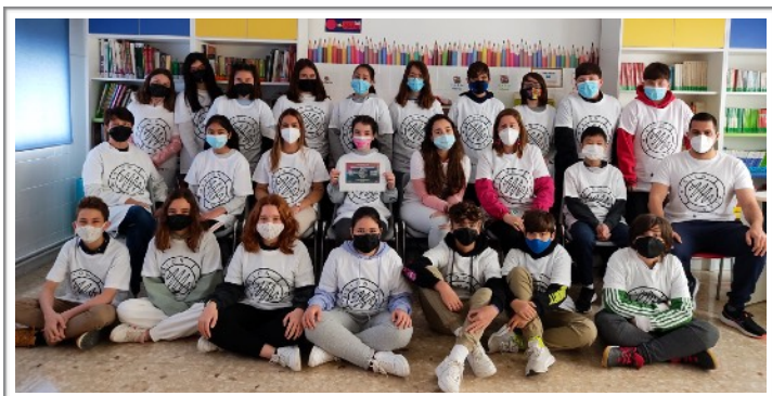
SÚPERPEMANES, COLEGIO CONCERTADO JOSE MARÍA PEMÁN - ALBACETE

Nos lo habéis pedido mucho y, después de todo... ¡Cómo no íbamos a hacerlo!